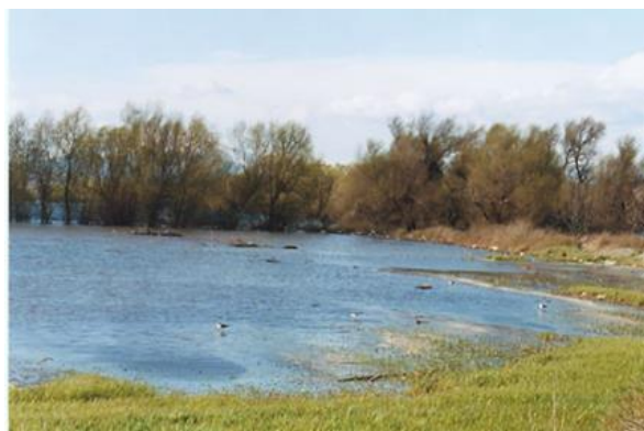
Εικόνα 5-1. Τεχνητή λίμνη Τάκα