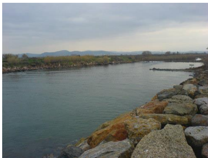
Εικόνα 7-1. Εκβολή ποταμού Ευρώτα (Ταμβακολόγος Ν.)

Περιγραφή: Η περιοχή βρίσκεται λίγα χιλιόμετρα ανατολικά της πόλης του Γυθείου, στο μυχό του Λακωνικού κόλπου. Ο ποταμός Ευρώτας είναι ένα από τα πιο ιστορικά ποτάμια της Πελοποννήσου. Έχει συνολικό μήκος περίπου 100 km και περνάει μέσα από την Σπάρτη. Η παρουσία του έχει συμβάλει σημαντικά στην οικονομία της περιοχής. Σήμερα, οι φυσικοί βιότοποι έχουν περιοριστεί σε μια στενή λωρίδα κατά μήκος του ποταμιού, ενώ όλη η υπόλοιπη περιοχή έχει μετατραπεί σε καλλιεργούμενες εκτάσεις. Μικρές κηλίδες αδιατάρακτων φυσικών οικοσυστημάτων συναντά κανείς σήμερα μόνο κατά μήκος κυρίως του ποταμού και των καναλιών, στις εκβολές του, καθώς και στις αμμώδεις παραλίες του δέλτα.