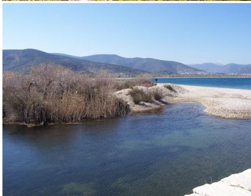
Εικόνα 6-1. Χερωνήσι, λιμνοθάλασσα Μουστού (πάνω) / Λιμνοθάλασσα Μουστού (κάτω)