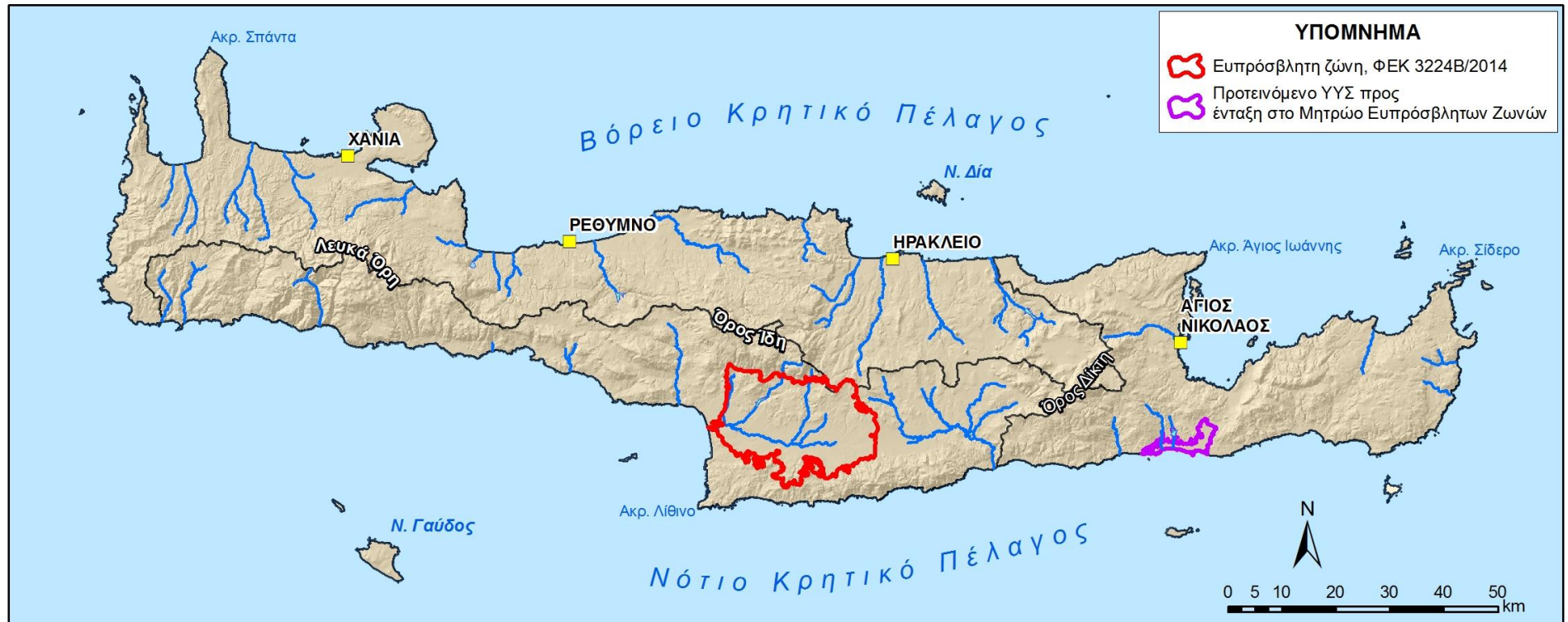
Εικόνα 7-1 Ζώνες Ευπρόσβλητες στη Νιτρορύπανση