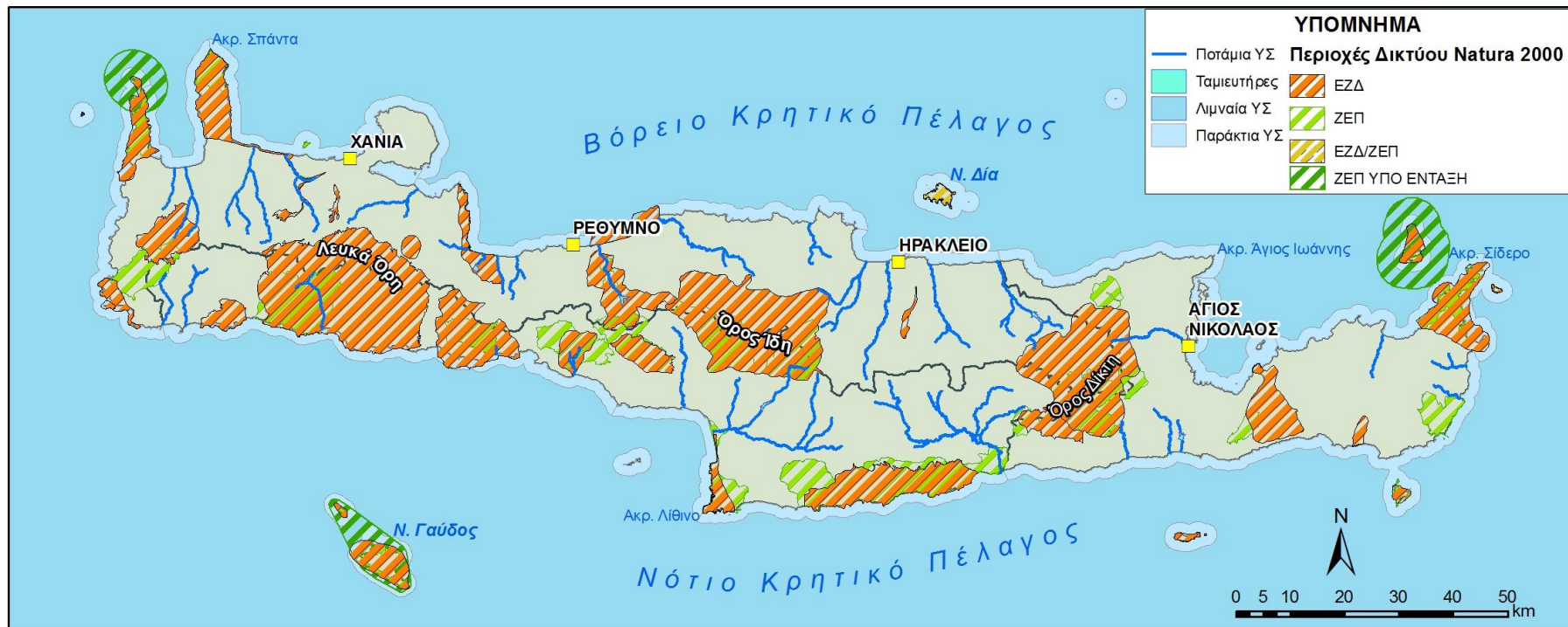
Εικόνα 8-2 Περιοχές του Δικτύου Natura 2000 που εντάσσονται στο ΜΠΠ του ΥΔ 13