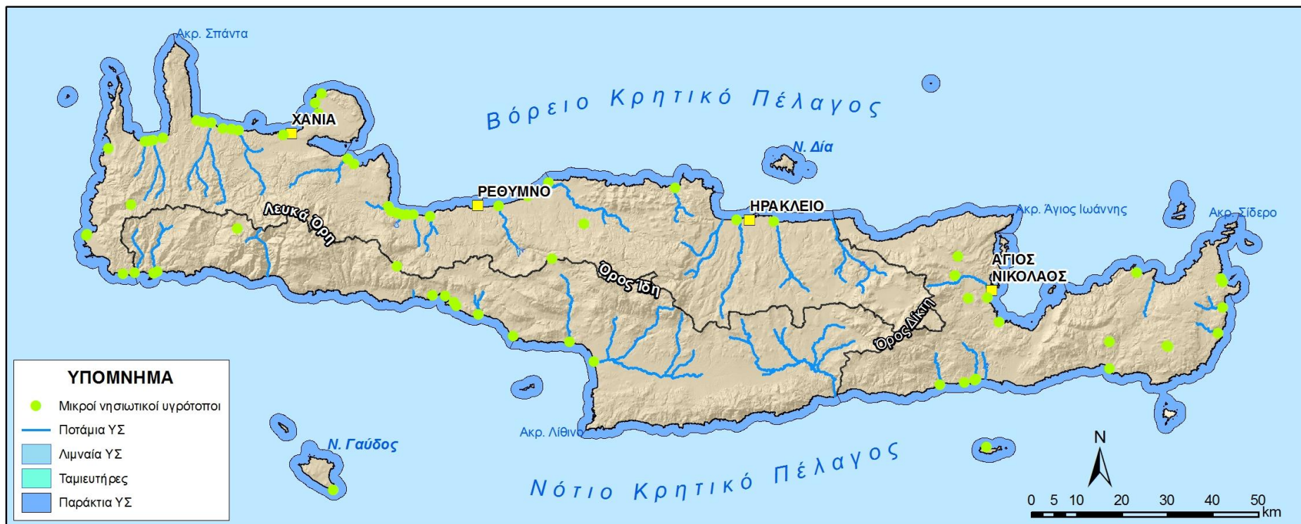
Εικόνα 8-3 Μικροί νησιωτικοί υγρότοποι στο ΥΔ 13