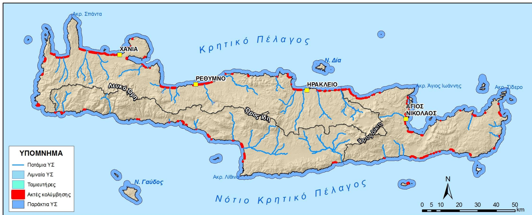
Εικόνα 6-1 Ύδατα κολύμβησης στο ΥΔ 13