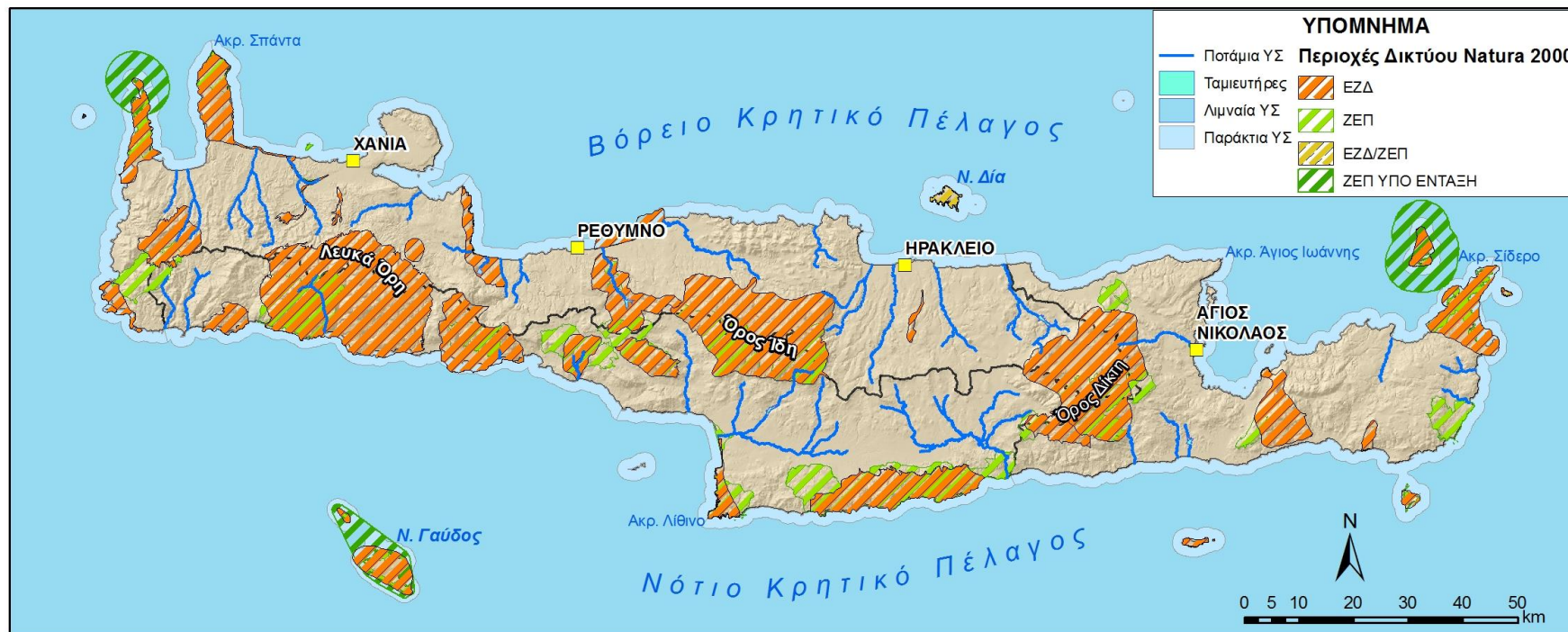
Εικόνα 8-1 Περιοχές του Δικτύου Natura 2000 στο ΥΔ 13