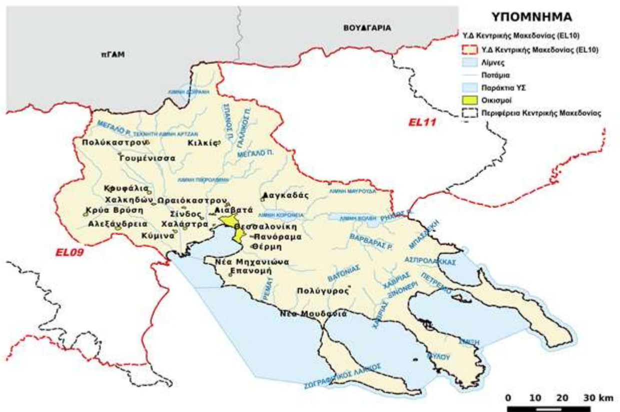
Εικόνα 2-1. Διοικητικός χάρτης Υ.Δ. Κεντρικής Μακεδονίας

Το υδατικό διαμέρισμα περιλαμβάνει εκτεταμένες πεδιάδες, κυρίως στο δυτικό τμήμα, οι σημαντικότερες από τις οποίες είναι αυτή της Θεσσαλονίκης, των Γιαννιτών και του Λαγκαδά, ενώ στο ανατολικό τμήμα διακρίνεται η λεκάνη της Χαλκιδικής. Δεν είναι ιδιαίτερα ορεινό, αφού περιλαμβάνει χαμηλά βουνά στην περιφερειακή ζώνη, ενώ υψόμετρο πάνω από 2.000 μέτρα έχουν το όρος Άθως (2.033 m) και το όρος Κερκίνη (2.031 m). Το μέσο υψόμετρο του Υ.Δ. είναι 245m,