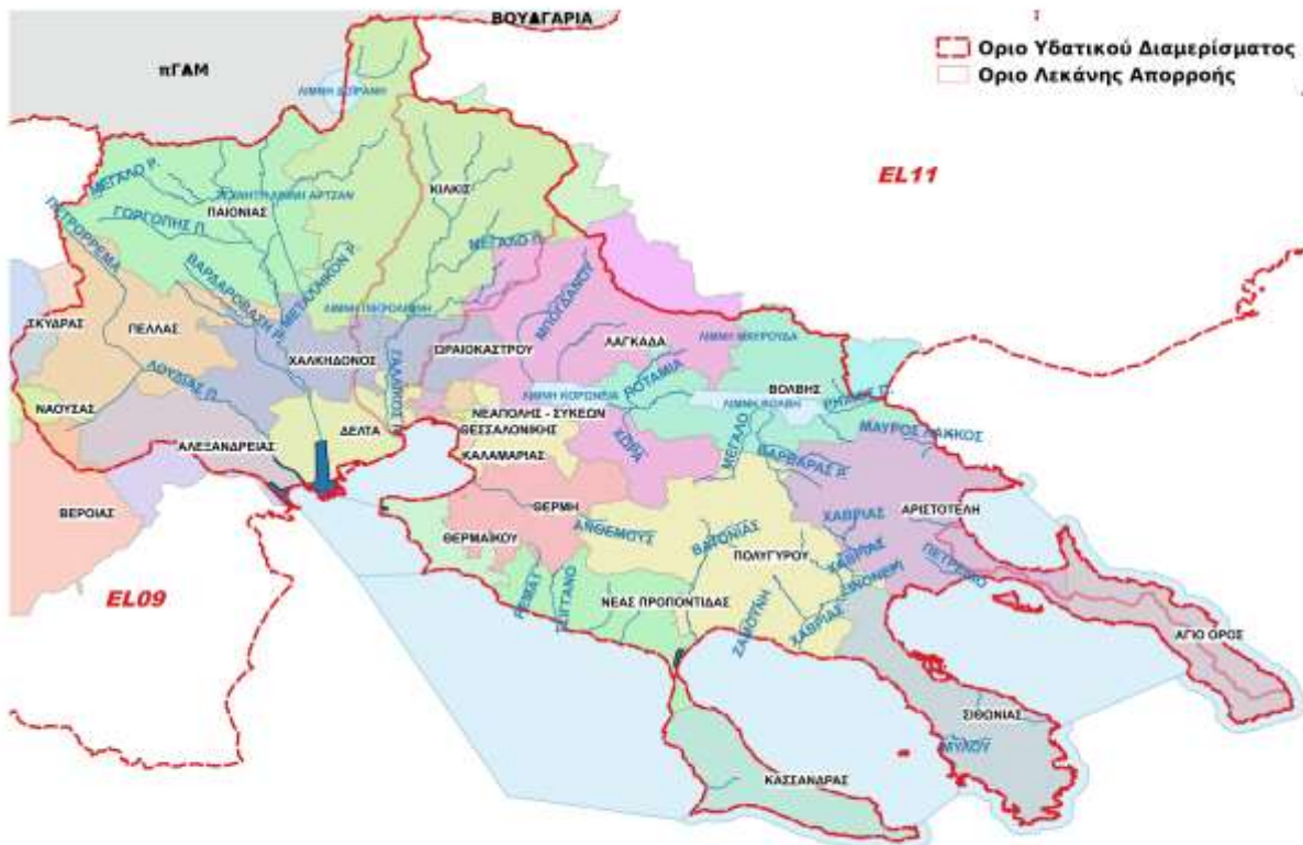
Εικόνα 6-1. Διοικητική Διαίρεση ΥΔ 10 σε επίπεδο Δήμων