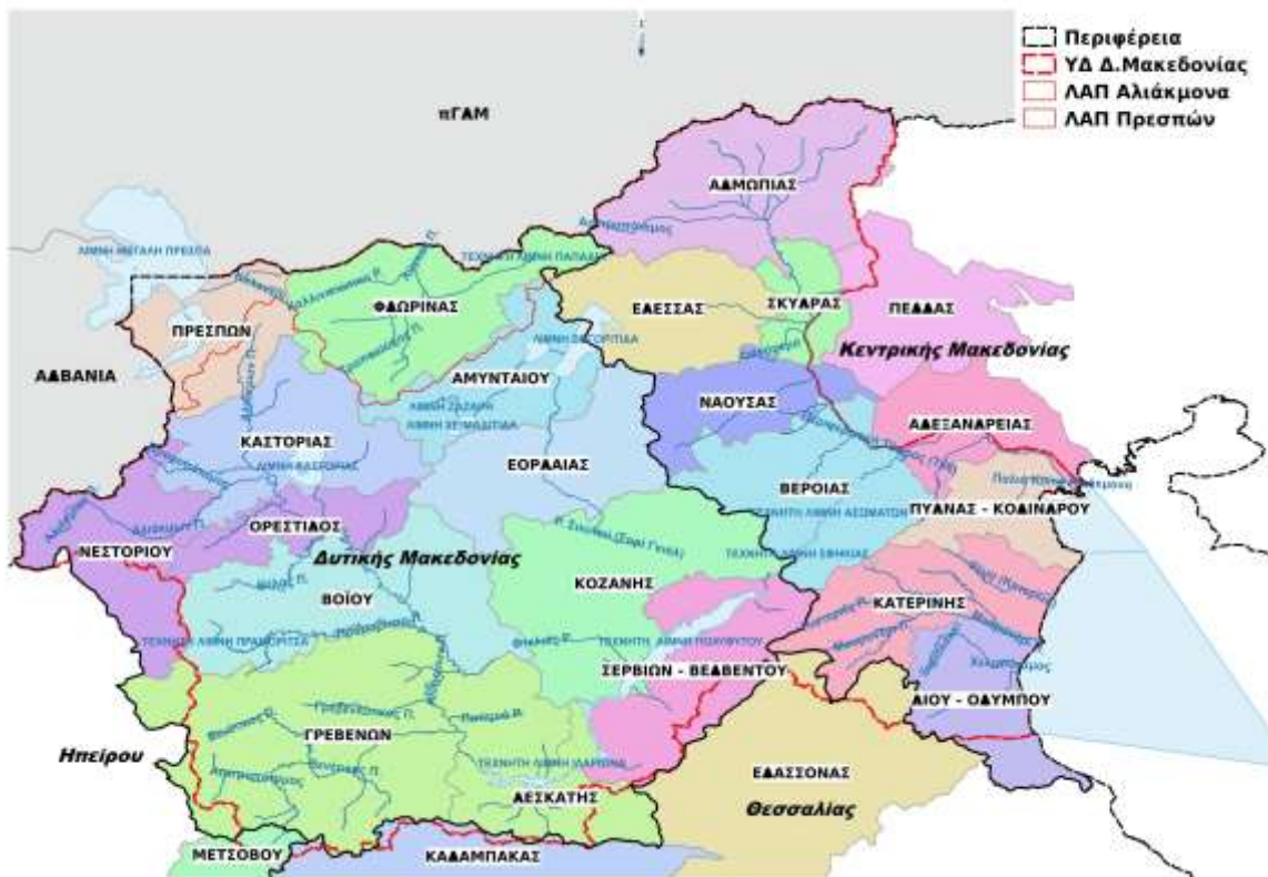
Εικόνα 6-1. Διοικητική Διαίρεση ΥΔ 09 σε επίπεδο Δήμων