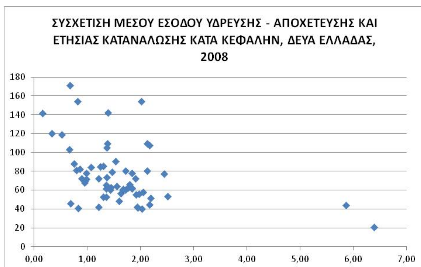
Σχήμα 4.1-1: Μέσο έσοδο

Χρησιμοποιώντας αφενός στοιχεία μέσου εσόδου ύδρευσης και αποχέτευσης ανά \mu^3 κατανάλωσης νερού ύδρευσης και αφετέρου στοιχεία μέσης κατά κεφαλή ετήσιας κατανάλωσης νερού σε περίπου 60 ΔΕΥΑ της χώρας, προκύπτει ότι στις ΔΕΥΑ με χαμηλό μοναδιαίο έσοδο, η κατά κεφαλή κατανάλωση νερού τείνει κατά κανόνα να είναι μεγαλύτερη (επόμενο διάγραμμα) έστω και εάν η συσχέτιση αυτή δεν είναι πολύ υψηλή (συντελεστής συσχέτισης ίσος με -0,41).